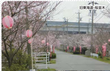
旧東海道・桜並木

柿地区内の旧東海道沿いに植えられた見事な桜並木。桜を見ながらウォーキング出来ます。