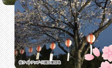
桜ライトアップ(川越市栗園地)