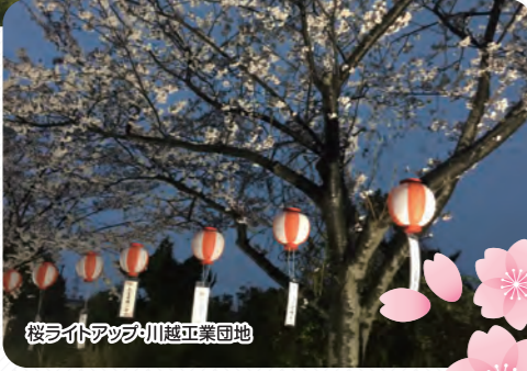
桜ライトアップ・川越工業団地