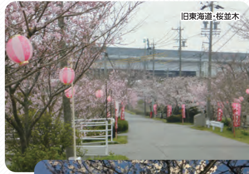
旧東海道・桜並木

柿地区内の旧東海道沿いに植えられている桜並木。桜を見ながらウォーキング出来ます。