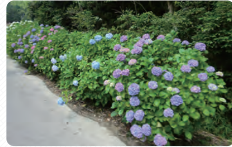
あじさいロード(朝日町)