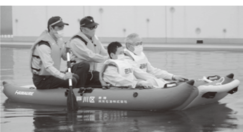
救助用ボートの事例

再 避難タワーについて、今後予定はないが、国や県から出される被害想定によつては、新たな建設もあるのか。