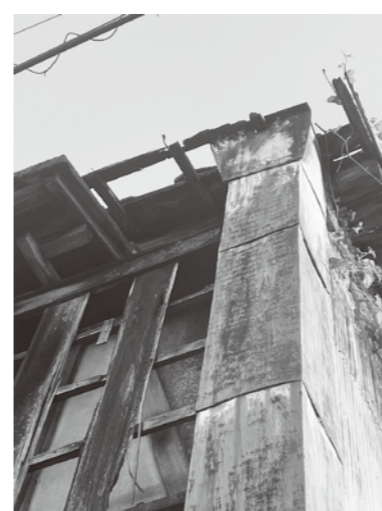
危険な空き家の外壁

国土交通省 空き家の発生を抑制するための特例措置(空き家の譲渡所得の3,000万円特別控除)