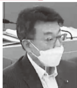
山下 裕矢 議員