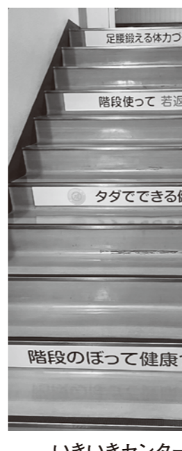
いきいきセンターの階段