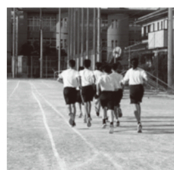
陸上部の練習風景