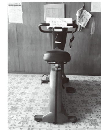
点検が遅れていた器具

サイドの劣化で、利用者の安全確保が困難と判明し今年度も営業を中止した。総合体育館の長寿命化改修も控えているので大規模改修は合理的ではない。