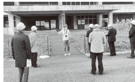
震災遺構となった気仙中学校