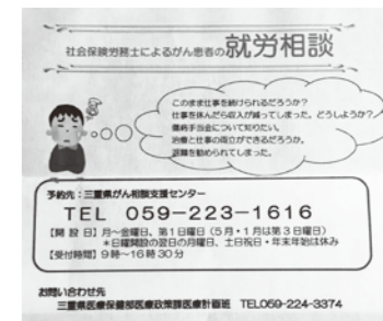
三重県がん相談先