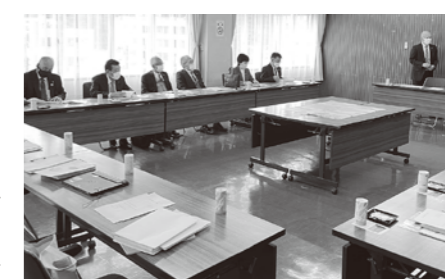
気仙沼市さんとの意見交換