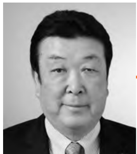
安藤 邦晃 議員