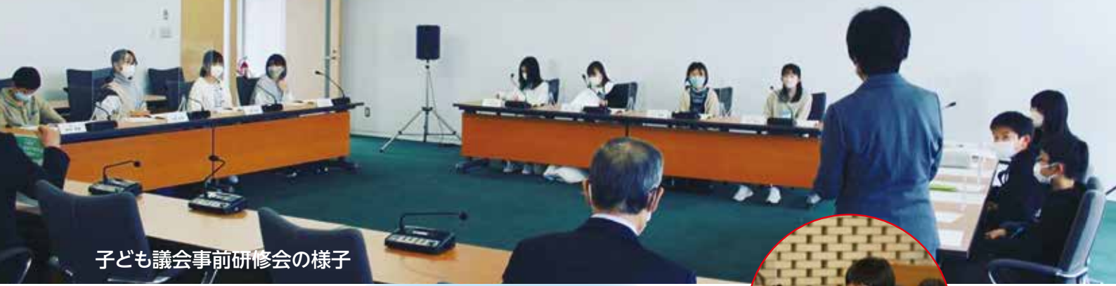
子ども議会事前研修会の様子