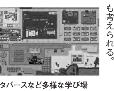
メタバースなど多様な学び場

また、庁舎内情報ネットワークの再構築と事務用機器を更新したことにより、業務の効率化が図られワークライフバランスの推進に努めている。