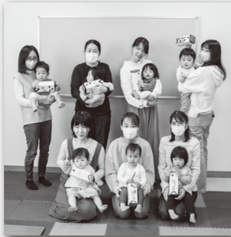
参加したみなさん