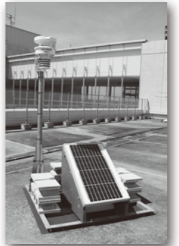
役場屋上に設置しています

テレビや一般的な天気予報のような「広い地域の予測」ではなく、「今、私たちの町がどうなっているか」というピンポイントな気象状況を、スマートフォンやパソコンからリアルタイムで確認することができます。