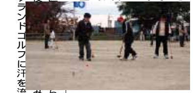
清掃活動のあとは、みんなで楽しくスポーツ！

11月26日(日) 豊田地区の三世代ふれあい事業が行われました。毎年行われている事業ですが、今回から三世代によるゴミ拾い・草取りなどの清掃活動が盛り込まれ、朝早くから地区内のいたる所で区民が入り混じってのグラウンドゴルフに汗を流しました。