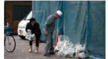
朝の寒い時期ですが、自分たちの住む地区をきれいにしようと気持ち体が動きます。

11月26日(日) 豊田地区の三世代ふれあい事業が行われました。毎年行われている事業ですが、今回から三世代によるゴミ拾い・草取りなどの清掃活動が盛り込まれ、朝早くから地区内のいたる所で区民が入り混じってのグラウンドゴルフに汗を流しました。