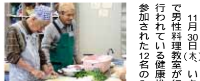
食べるのは簡単ですが、作るのは手間と時間がかかるんです！

11月30日(木) いきいきセンター栄養指導室で男性料理教室が行われました。これは毎月行われている健康推進課の事業で、この日は参加された12名のみなさんが「計量をきちんとする」「ことを目標に、それぞれの班に分かれヘルスメイトさんの指導で、さわらのかぶら蒸しや「プリン」など4品目の料理に取り組みました。教室に参加ご希望の方は健康管理センターまでお問い合わせ下さい。365・1399