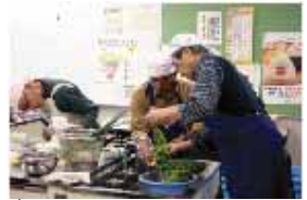
みなさん、時には困った顔もさされましたが、明るい笑顔がいっぱいでした。

11月30日(木) いきいきセンター栄養指導室で男性料理教室が行われました。これは毎月行われている健康推進課の事業で、この日は参加された12名のみなさんが「計量をきちんとする」「ことを目標に、それぞれの班に分かれヘルスメイトさんの指導で、さわらのかぶら蒸しや「プリン」など4品目の料理に取り組みました。教室に参加ご希望の方は健康管理センターまでお問い合わせ下さい。365・1399