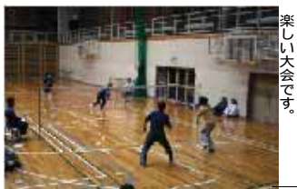
初心者の方も参加できる、楽しい大会です。

11月26日(日) 町総合体育館において、バドミントン大会が開催されました。寒さの厳しい時期ですが、体育館の中は参加者の熱気に包まれました。試合は当日に組まれたチームで行われ、好プレーだけでなく、珍プレーもたくさん見られ、楽しい雰囲気の中、試合が進められていきました。