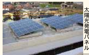
太陽光発電パネル