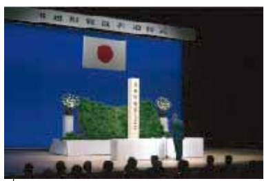
参加者による献花が行われました。

11月18日(土) あいあいホールにおいて、川越町戦没者追悼式が挙行されました。この追悼式は、先の大戦において不幸にして亡くなられた方に哀悼の誠を捧げるとともにご冥福を祈り、平和を祈念するために開催されました。戦争経験者の方による体験談などが発表された後、参加者による献花が行われました。