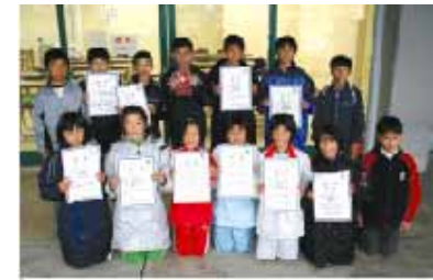
全国大会出場を決め、喜びの表情の選手たち。

第30回川越町健康づくりマラソン大会 12月3日(日) 町総合運動場周辺をコースに9部門に分かれてマラソン大会が開催されました。結果は左表のとおりです。