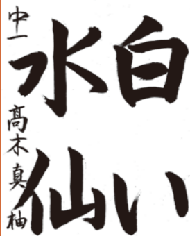
【中学生の部】最優秀賞作品